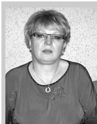
У 2013–2014 н. р. у 5 класі почалось навчання історії за новою навчальною програмою (2012 р.), побудованою відповідно до нового Державного стандарту базової і повної середньої освіти (2011 р.). Ця програма за змістовим наповненням суттєво відрізняється від попередньої, а тому потребує особливого наголосу на методиці її втілення і перегляду вчительського потенціалу для її ефективного впровадження.

Роль учителя в такому разі змінюється, він стає помічником у навчанні учнів, їхнім активним консультантом, творчим партнером у пошуку відповідей на проблемні запитання уроку. Дуже важливим при цьому стає питання вибору ефективних методик і технологій під час проектування уроків. Саме таких, які б: працювали на результат; давали можливість засвоювати знання за ко-